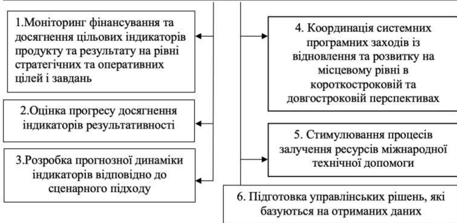
Fig. 1. System of monitoring and evaluation of territorial community development strategies