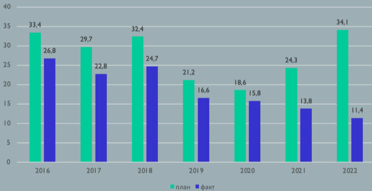
Fig. of the Ministry of Regions in planned and actual expenditures for regional and local development in 2016-2022,